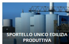
SPORTELLO UNICO EDILIZIA PRODUTTIVA