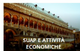
SUAP E ATTIVITÀ ECONOMICHE