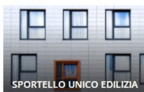
SPORTELLO UNICO EDILIZIA