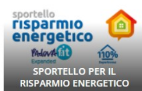
SPORTELLO PER IL RISPARMIO ENERGETICO