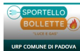
SPORTELLO BOLLETTE "LUCE E GAS" URP COMUNE DI PADOVA